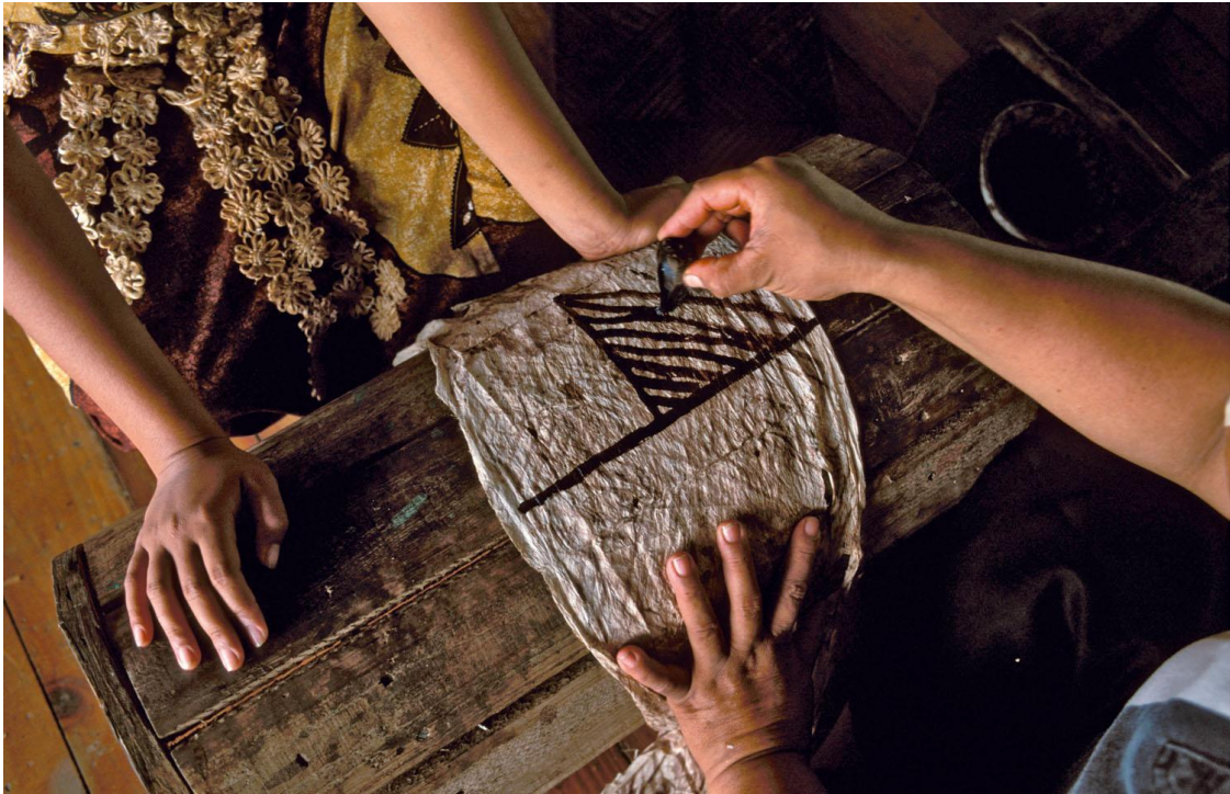
fig. 4 Peinture sur tissu aux îles Tonga.