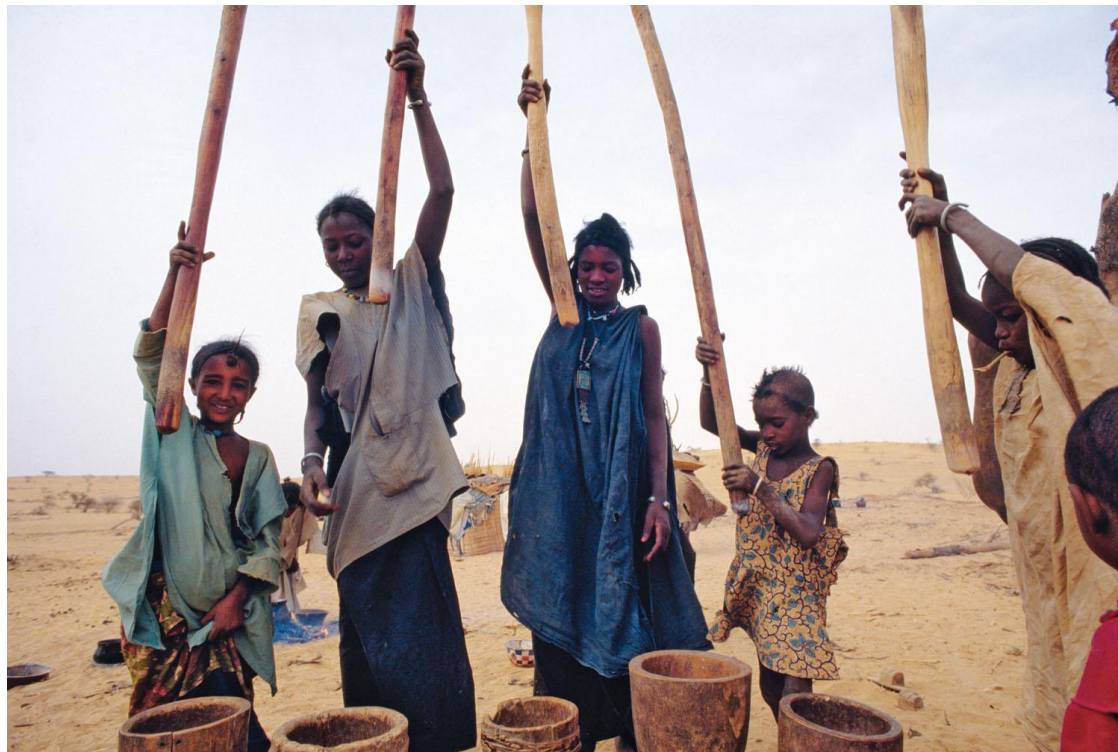
fig. 1 Jacques Haillot, Femmes touarègues Kel Kummer du Mali pilant du mil, 1980.

la nécessaire coordination des gestes ; mais, tout en répondant à une nécessité fonctionnelle, ce tempo donne comme un air de fête au bruit sourd des pilons qui s'abattent en deux ou trois temps dans le mortier, tandis que les femmes font claquer leur langue et frappent dans leurs mains. Et souvent elles sourient à cette fête malgré leur fatigue.