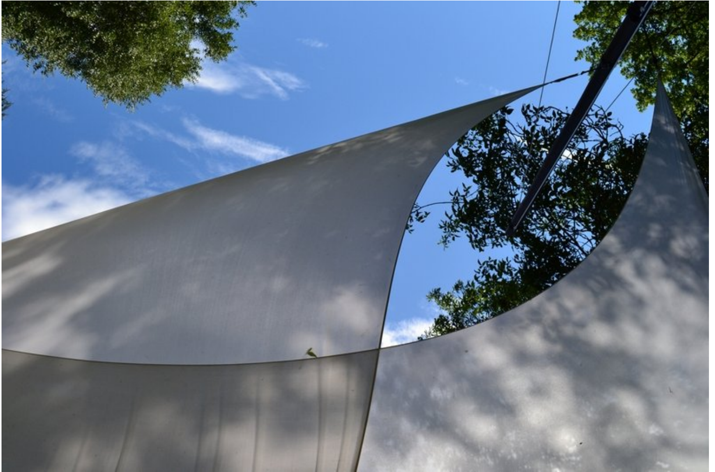
Photo : installation pour « Silencio », d'agnès Varda, 2015 l'Aiguebrun (84)

Arrivé au coeur, à la nacre intestinale, utérine Mais qui abrite, mais n'enferme Et l'on reboucle l'article 8 mars (D'Avignon, en cette nuit du 7 mars) en cette même résidence Â« Rhuthmos Â» « Ecrans poreux, qui diffusent aussi, du vaste dehors vers l'intime dedans Tous les vents du lieu, tous les messages d'Alizés ; toutes les chaleurs, toutes les odeurs, toutes les vapeurs « L'habitant » est dans tous ses sens, en tous sens A distance du monde, l'abri lévite ; il anti-gravite Machine réflexive : captation exploratoire, captation sensorielle L'on y aspire le lieu, l'on expire son être Qui retient du paysage, l'hommage « Et l'univers, l'épouse »