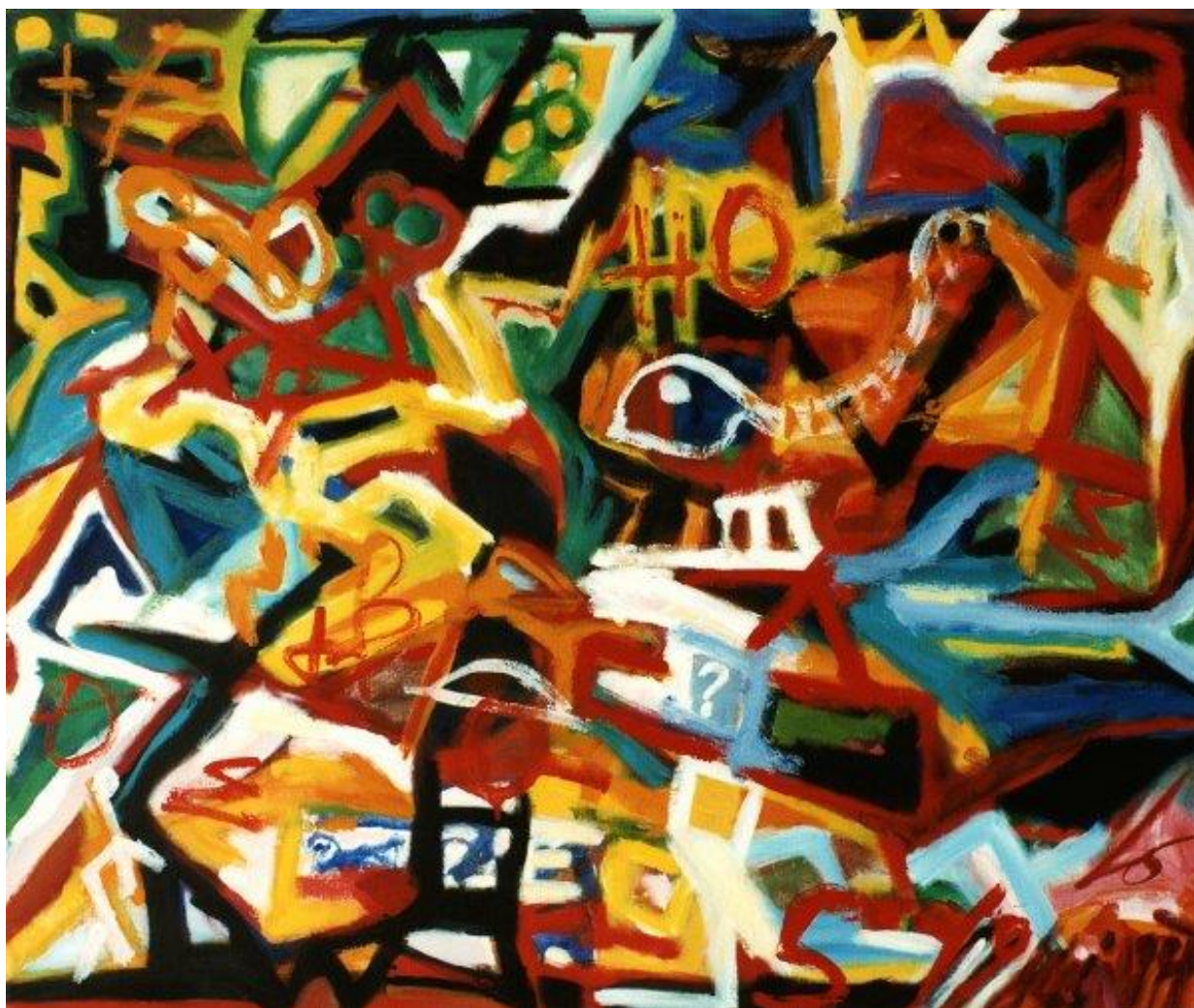
Chemin des écritures #38, 1997, Micheline LO