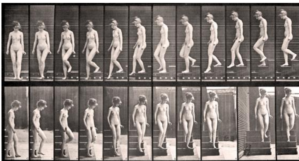
Eadweard Muybridge - "Descending Stairs and Turning Around"