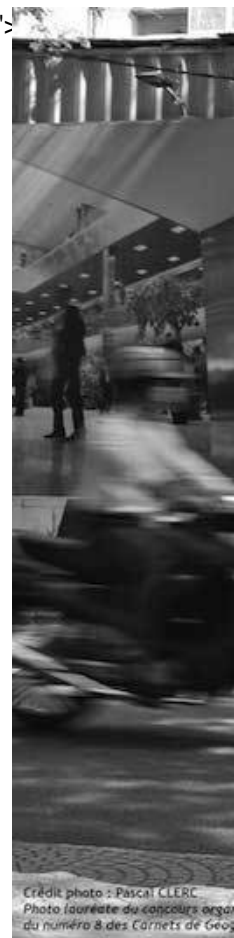
Photo lauréate du concours organisé dans le cadre du numéro 8 des Carnets de Géographes.

<span class='spip_document_2769 spip_documents spip_documents_left' style='float:left; width:800px;'